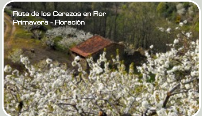
Ruta de los Cerezos en Flor Primavera - Floración

En primavera durante la floración de los cerezos realizaremos la “Ruta de los Cerezos en Flor” .