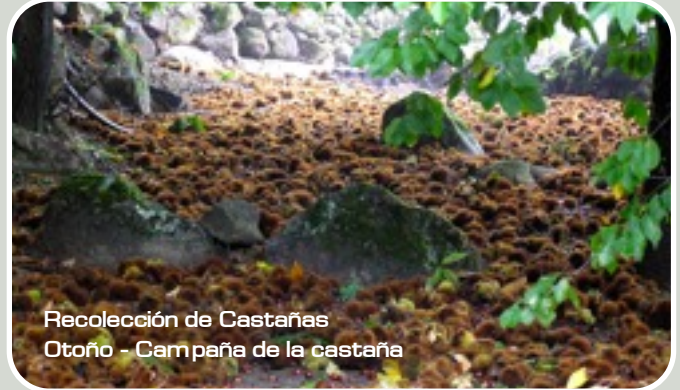
Recolección de Castañas Otoño - Campaña de la castaña

En otoño recolectaremos castañas , y conoceremos su proceso. Este rico fruto del otoño es otra de las producciones agrícolas significativas en el Valle del Jerte.