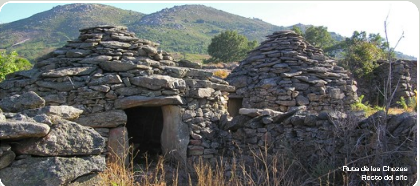
Ruta de las Chozas Resto del año

El resto del año realizaremos la “Ruta de las Chozas” para conocer la arquitectura vernácula tradicional en el Valle del Jerte y haremos prácticas en el Huerto Ecológico de Alberjerte.