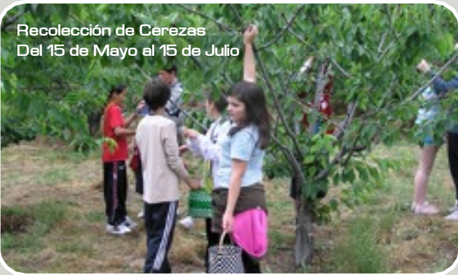
Recolección de Cerezas Del 15 de Mayo al 15 de Julio

Desde el 15 de mayo al 15 de julio aproximadamente, visitaremos una explotación agrícola para vivir in situ la campaña de cerezas .